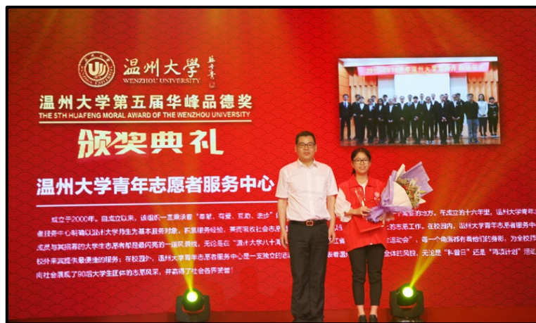
图 7 华峰品德奖颁奖典礼

可能影响社区的工程项目，公司会在项目实施前与社区居民代表进行相互协商，谋求共识。同时，公司积极参与社区公益事业，通过集团“华峰诚志助学金”、“温州大学华峰品德奖”等平台，帮助困难学子，激励优秀师生；并出资助力“五水共治”，共建浙南美丽水乡。公司还鼓励和支持员工投身社区志愿服务，公司成立“蓝精灵”青年志愿者先锋队，2016年先锋队先后开展了“亲子华峰游”、“七彩阳光进校园”等志愿者服务活动，在积极参与和支持社区发展的同时，也丰富了青年员工的业余文化生活。