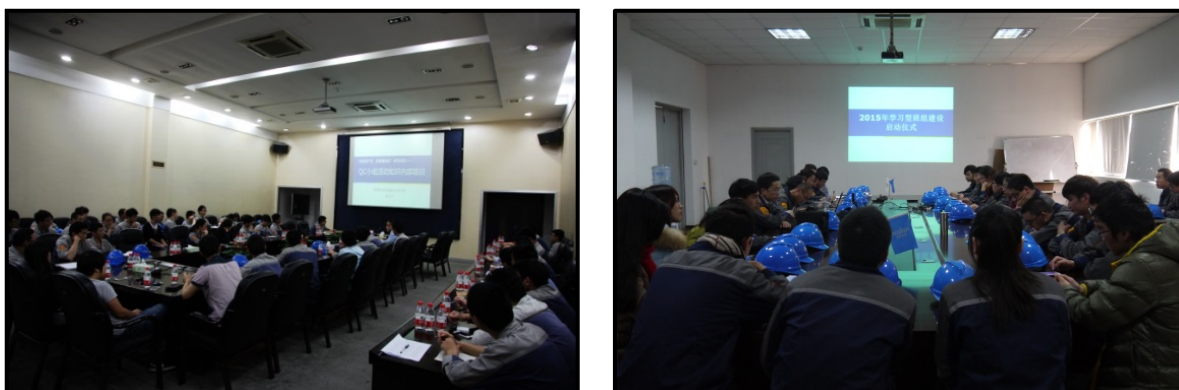
图 4 各部门开展质量诚信建设相关活动