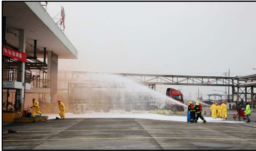
图 3 应急预案演练