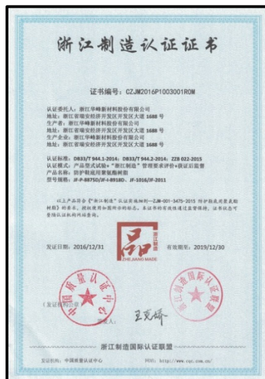
图 8 浙江制造认证证书

2016年，华峰新材料公司的产品在国家各级质检部门的质量监督抽查中，均未发现不合格现象。公司 JF-P-8875D/JF-I-8918D 系列防护鞋底用聚氨酯原液产品还顺利通过了“浙江制造”审核认证。