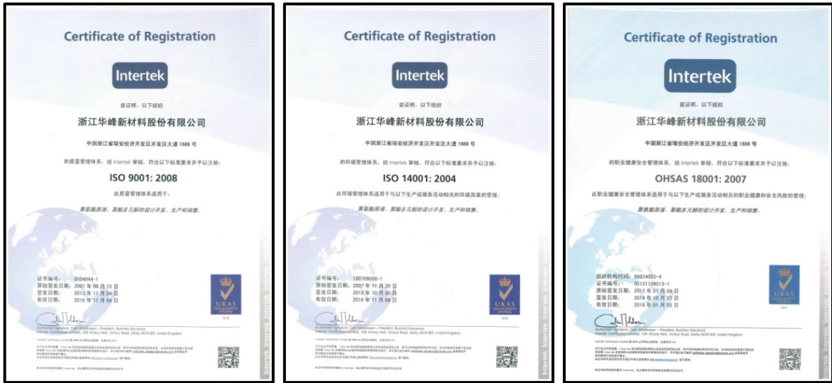
图 2 ISO 9001、ISO 14001、OHSAS 18001 体系认证证书

公司每年年初将年度质量目标分解至各部门，通过关键绩效指标考核体系对各部门进行逐月考核，各部门再将相关指标分解至生产班组或具体岗位，确保质量管理责任落实到位。同时，公司大力开展员工产品质量教育及业务能力培训，通过多层次、多形式、多渠道、差异化的培训模式，不仅提高了员工的业务能力，而且提升了员工对企业质量文化的理解。