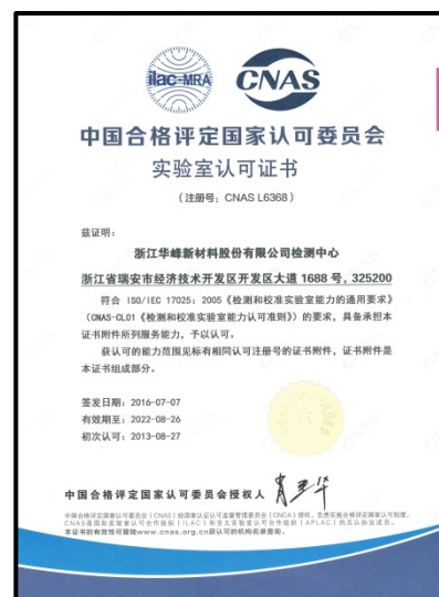
图 5 国家认可实验室证书